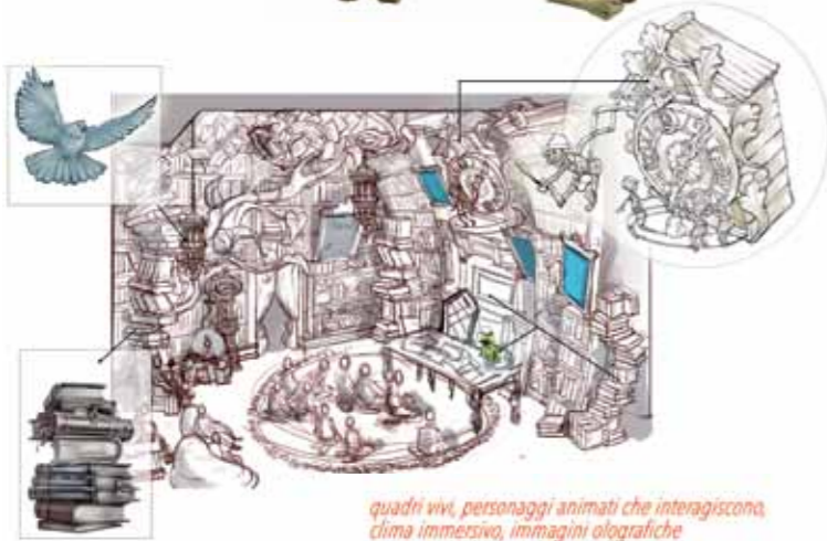
quadri vivi, personaggi animati che interagiscono, clima immersivo, immagini olografiche